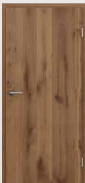
GREENLINE PRESTIGE Hrast »Alteiche« uljeni

GREENLINE PRESTIGE Hrast »Alteiche« mat lakirani