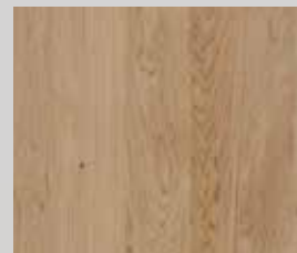
hrast grča natur lakirani