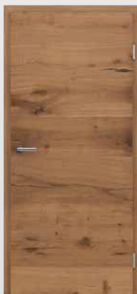
VIVACELINE / F4 PRESTIGE Hrast »Alteiche« mat lakirani