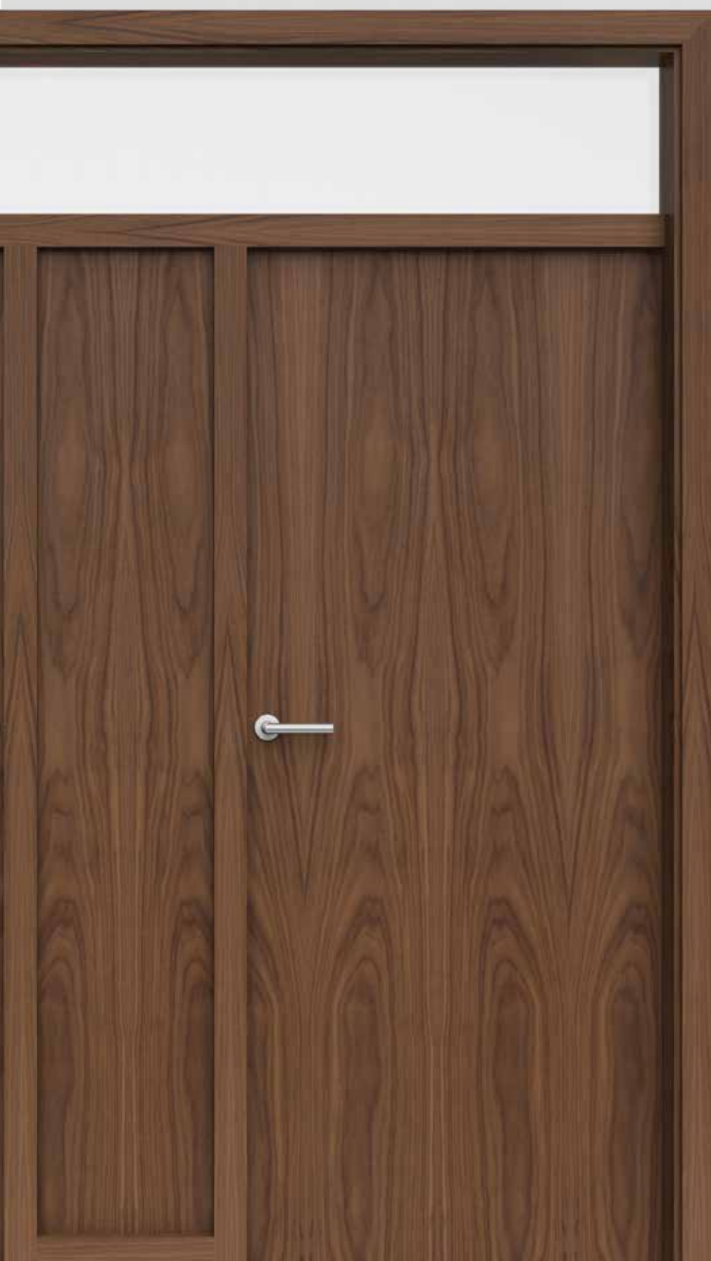
GREENLINE orah lakirano model DIVIDeline sa srednjim punjenjem i nadsvjetlom