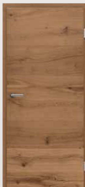
VIVACELINE / F4 PRESTIGE Hrast »Alteiche« uljeni