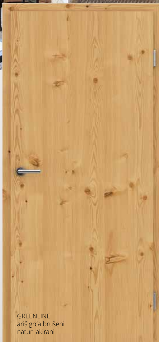
GREENLINE ariš grča brušeni natur lakirani

ARIŠ je naše jedino crnogorično drvo koje preko zime odbacuje svoje iglice. Šetnja kroz šumu ariša doista je nešto posebno. Budući da krošnje propuštaju veliku količinu svjetlosti, takva šuma je svijetla. Zato furnirana vrata od ariša lijepo pašu u svijetle i moderno dizajnirane prostore. Drvo je gusto, teško i izdržljivo zbog čega od njega izrađujemo proizvode koji su jako postojani.