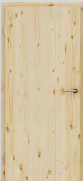
GREENLINE smreka grča brušena natur lakirana