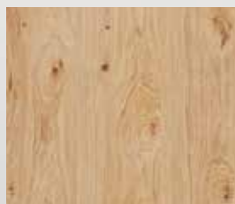
hrast grča brušeni natur lakirani