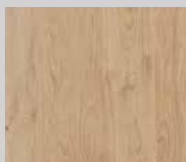
hrast grča mat bajčan lakiran