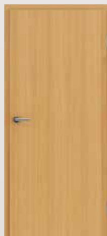
GREENLINE ariš brušeni natur lakirani