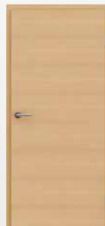
VIVACELINE / F4 ariš brušeni mat bajčan lakiran

Stara ljudska tradicija kaže nam da u šumama ariša žive šumske vile i baš su vile bile one koje su, kada je ariš zaželio imati iglice, plesale na vjetru kao lišće ostalih stabala. Iglice su se mijenjale u mekano zeleno lišće sve dok sa planina nije došla oluja koja mu je polomila grane i rastrgala lišće. Zatim je dobre vile zamolio da mu vrate iglice. Kao opomenu je dobio takve iglice koje se svake jeseni pozlate i otpadnu kao i lišće s ostalih stabala. Zato jer vile vole šume ariša još uvijek žive u njemu.