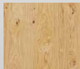
hrast grča uljen