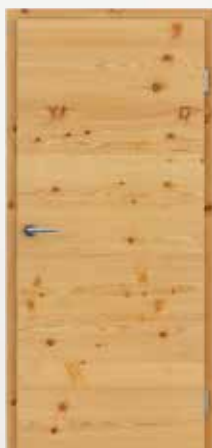
VIVACELINE / F4 ariš grča brušeni natur lakirani