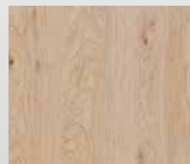
hrast grča brušeni bijelo uljeni