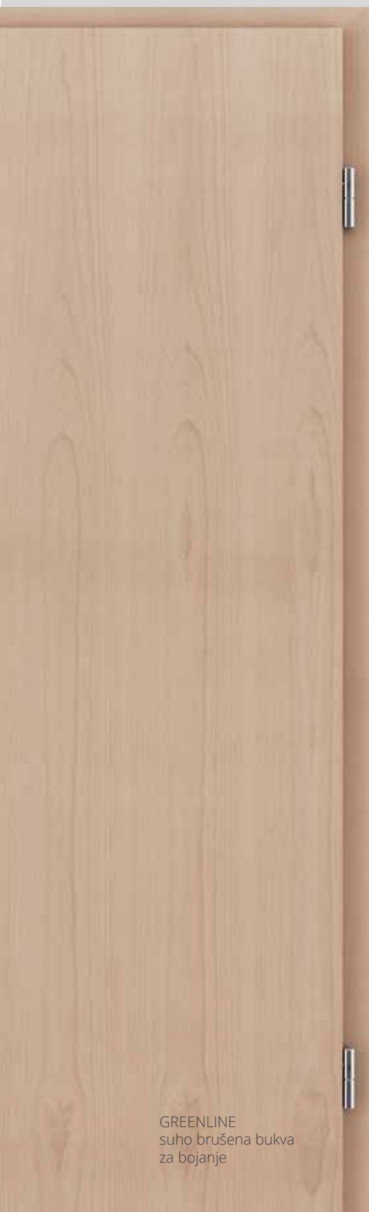
GREENLINE suho brušena bukva za bojanje

Razvedena površina od sastavljenog furnira pruža vam raznoliki izbor boja i oblika.