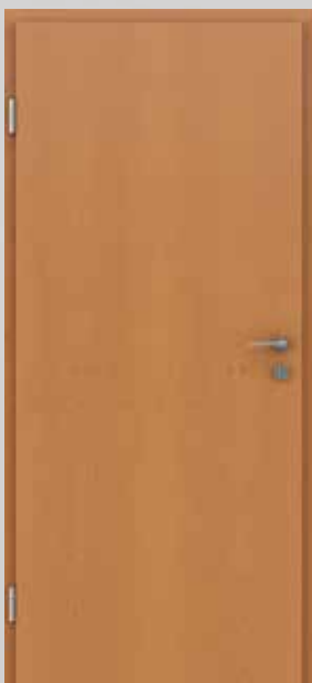
GREENLINE joha tonirana