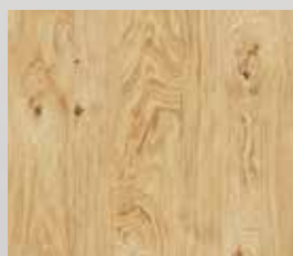
hrast grča brušeni uljeni