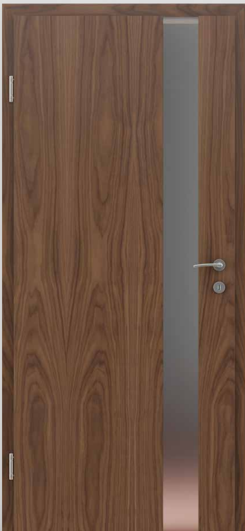
GREENLINE orah model LIFELINE PN2

Priroda je originalna. Njezini ljubitelji zato žele umirujuće boje i oblike koji same svjedoče o svojoj kvaliteti. Jedinstvena struktura površine odgovara modelima s drvorezom.