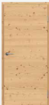
VIVACELINE / F4 ariš grča brušeni mat bajčan lakiran