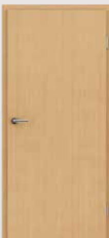
GREENLINE ariš brušeni mat bajčan lakiran